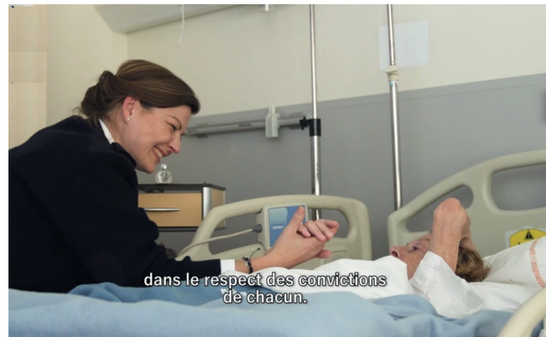
dans le respect des convictions de chacun.