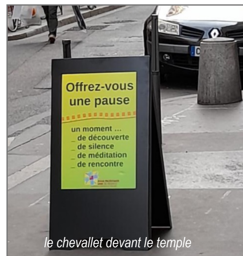
le chevallet devant le temple