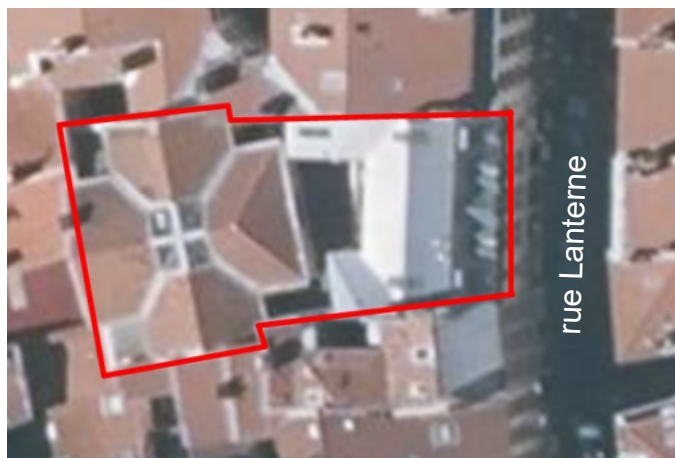
Le toit de la chapelle en forme de croix avec sa verrière centrale. En gris clair le toit du bâtiment sur la rue Lanterne.

entretien avec Sylvain Godinot par Olivier Durand-Evrard